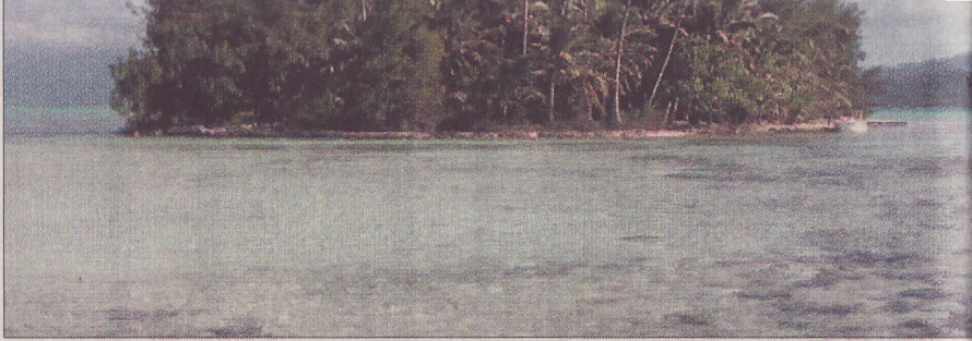
Inselträume können ganz verschieden sein: Manche Menschen lockt der Zauber eines Palmen-Eilands: Das Motiv links zeigt Motu Moute Island in Französisch-Polynesien im Pazifischen Ozean, das der Inselmakler Farhad Vladi zum